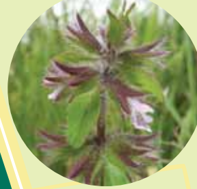
ACKER-ZIEST stark gefährdet