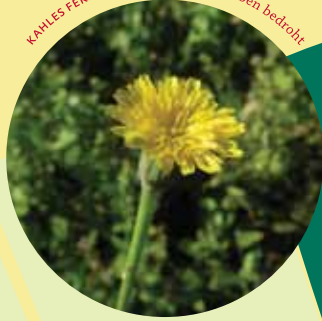
KAHLES FERKELKRAUT vom Aussterben bedroht